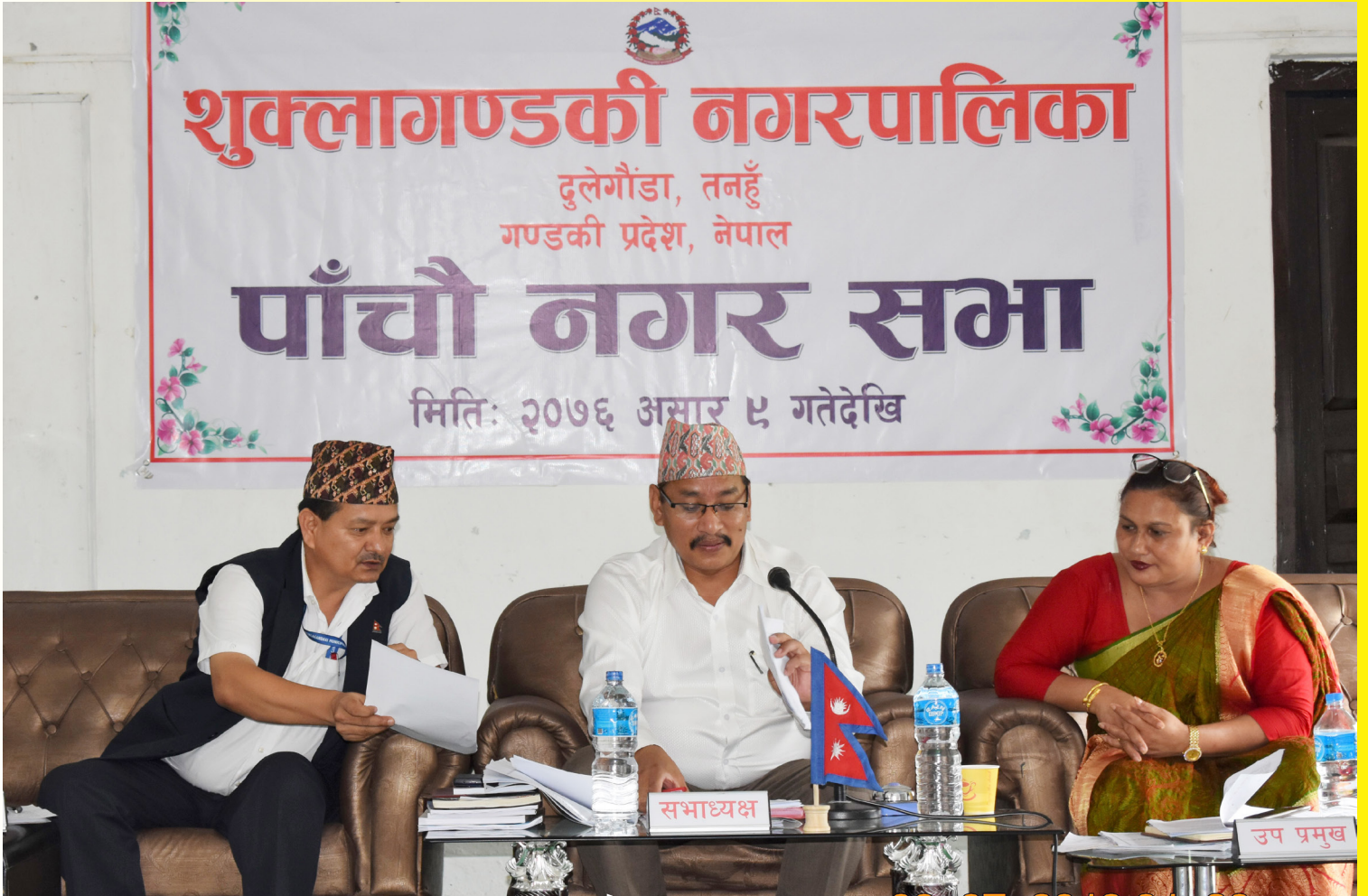
पाँचौ नगर सभा