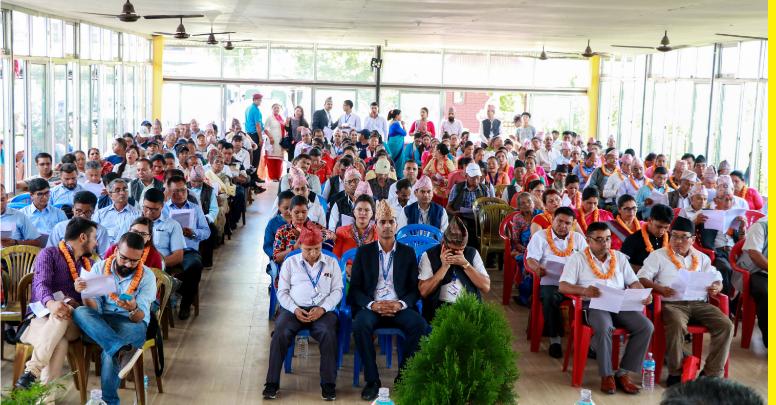
पाँचौ नगर सभा (बजेट, नीति, योजना तथा कार्यक्रमको प्रस्तुतीकरण) उद्घाटन समारोह