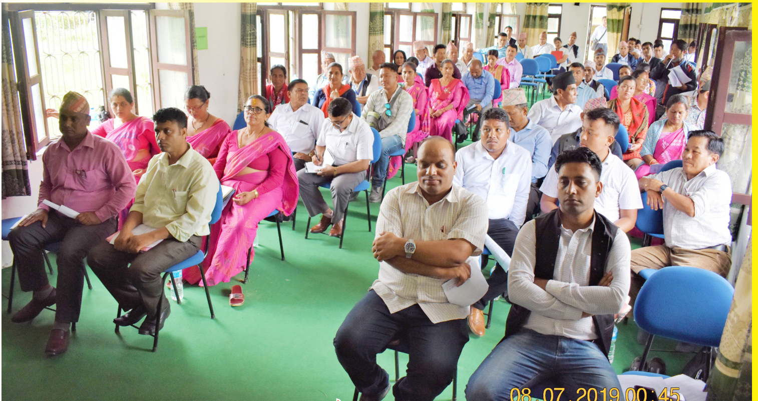
पाँचौ नगर सभा