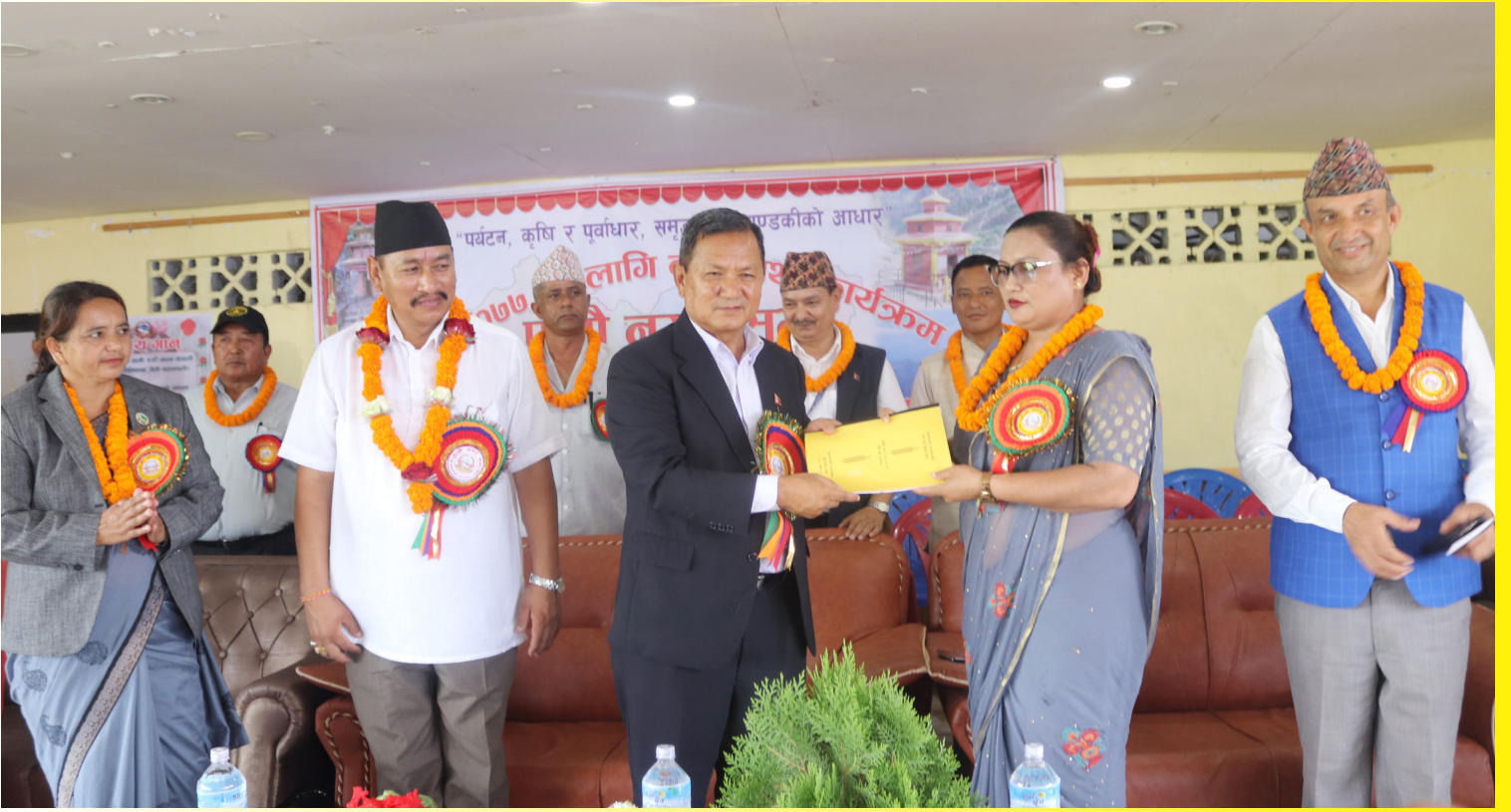
पाँचौ नगर सभा (बजेट, नीति, योजना तथा कार्यक्रमको प्रस्तुतीकरण) उद्घाटन समारोह